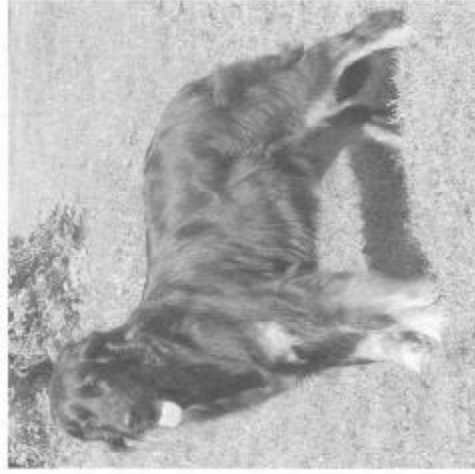
Ch. ČR Jakie Královské zátíši