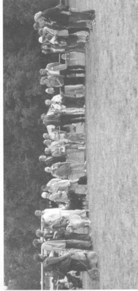
IHF v Kroměříži