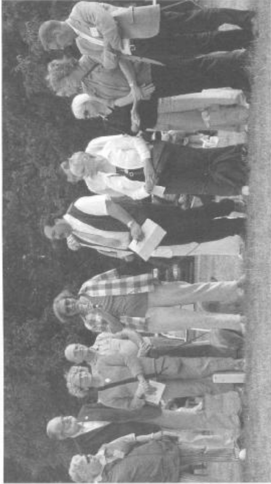
IHF v Kroměříži