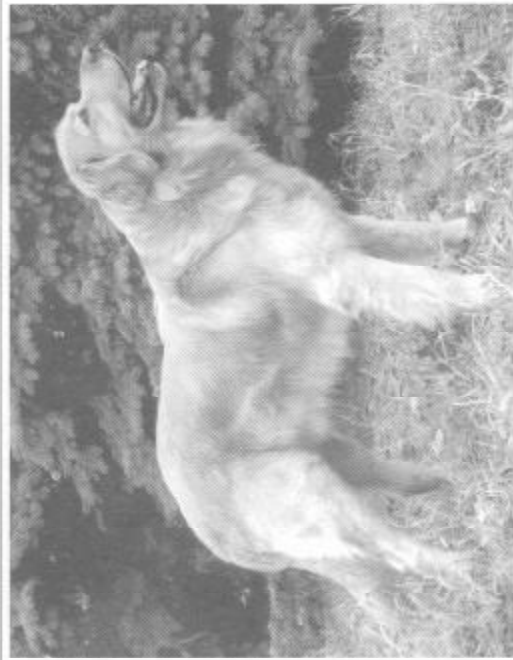
Grand z Páralovy zahrady

Příručku pro chovatele Hw , kde jsou veškeré informace o organizaci chovu Hw i o organizaci klubu včetně jeho řádů s přílohou přihlášky na svod a bonitaci, lze získat, po zaslání 40 Kč a ořádkované obálky (10 Kč) formátu A5 s nadepsanou vlastní adresou, na adresu předsedy klubu.