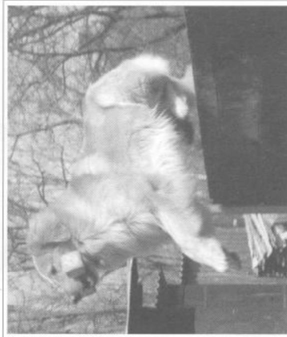
Carleon Gold Mondeo