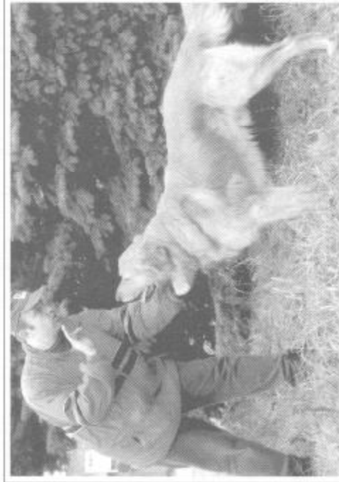
Luděk Valenta a Grand z Páralovy zahrady

Vynikajícího úspěchu ve výcvikové činnosti dosáhl pan Luděk Valenta se svým psem Grandem z Páralovy zahrady . Po zkouškách typu ZOP, ZPU a IPO složil kompletní řadu zkoušek služebního výcviku, včetně té nejobtížnější, kterou je ZVV 3. Je to v pořadí teprve po druhé co takovou zkoušku složil hovawart a Grand je jediným dnes žijícím plemenikem, který se touto zkouškou může pochlubit.