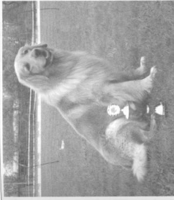
Carleon Gold Mondeo Speciální výstava HZD Weiden 29. 4. 2001