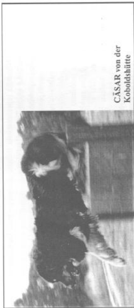
CÄSAR von der Koboldshütte