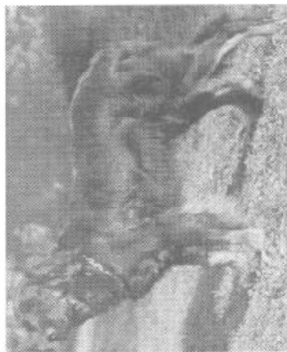
FEE vom Siegfriedshof