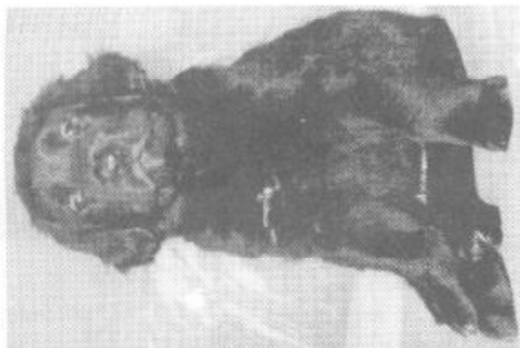
BATTUS - Slezský lán