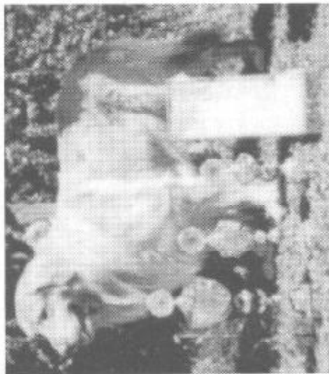
Elvis z Páralovy zahrady