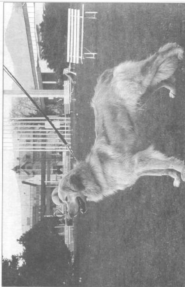
CILLA PLAVÝ VÍTR