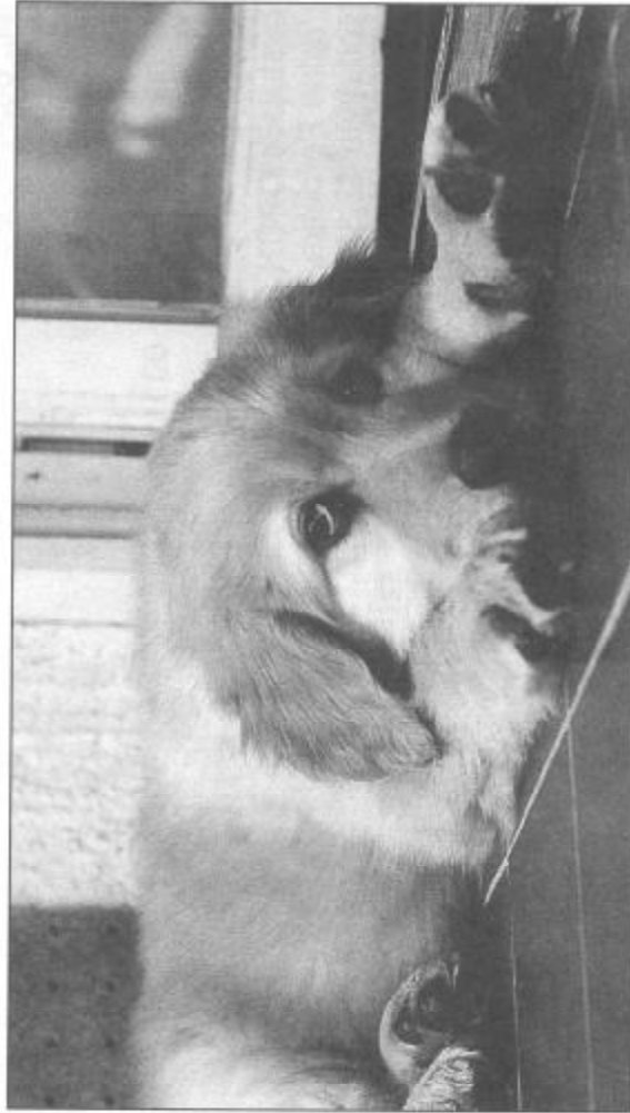
FILL PLAVÝ VÍTR

Pes v rodině. Praha, Svojtka a Vašut 1995, 127 s., brož. Kniha velmi instruktivně vede čtenáře v rozhodování při volbě psa a co péče o něho vyžaduje.